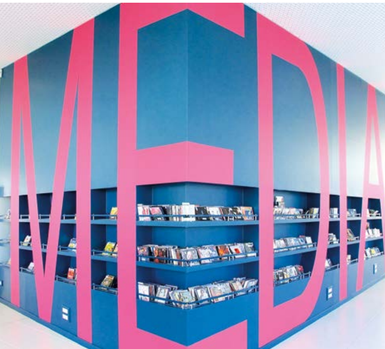
Médiathèque «La Page» de Pont-Audemer